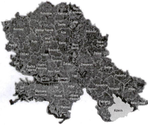
Положај општине Ковин у АП Војводини