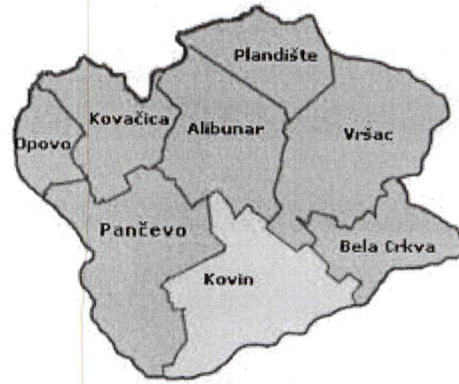
Положај општине Ковин у Јужнобанатском округу

У геоморфолошком погледу простире се највећим делом на лесној тераси и алувијалној равни Дунава. Јужну границу општине чини река Дунав у дужини од 46 км, на северу захвата Делиблатску пешчару, која од укупне површине од 29.620 ха, 63% припада подручју општине Ковин. Пешчара и Подунавље су две зоне које се преклапају у општини Ковин. Општина Ковин лежи на 20°05' - 20°23' источне географске дужине и 44°52' - 45°05' северне географске ширине. Општина лежи на надморској висини од 72 - 120 метара.